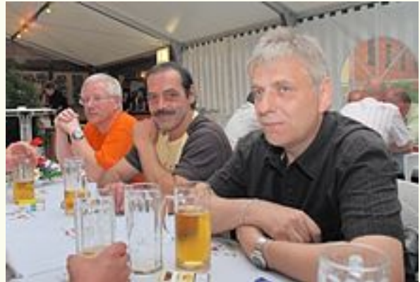
.. wird schon noch.