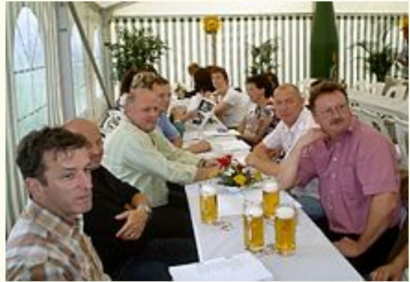
... harrte man der Dinge