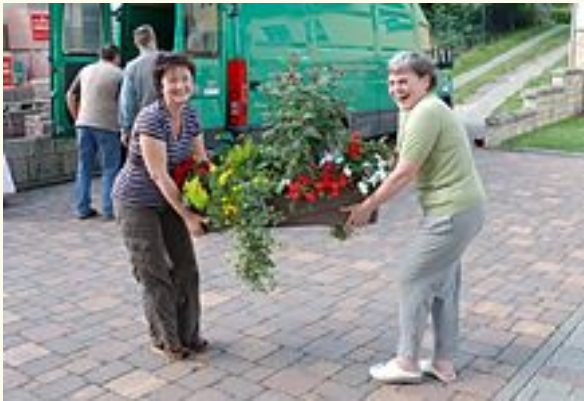
... wurden ganze Gärtnereien geplündert