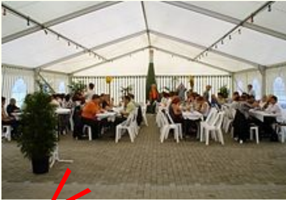
Dann vorbildlich von a nach d plaziert