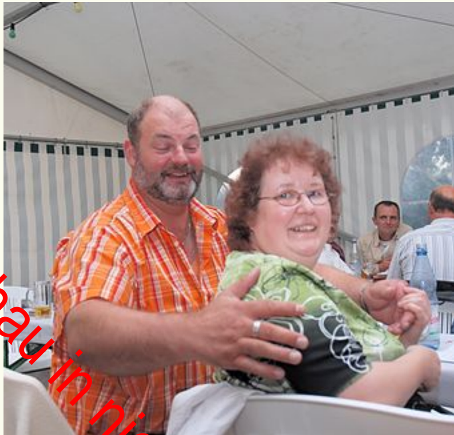
... vergessen geglaubte Bande neu belebt