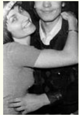
... glückliche Lehrer