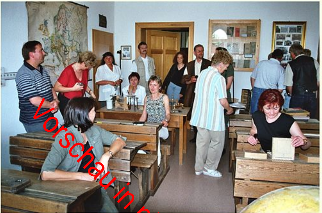
... ja ist ein bisschen gemogelt - das Bild ist vom letztem Treffen der 10b