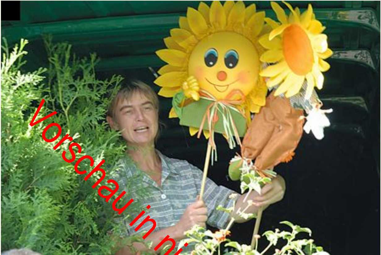
Als die Sonne aufgegangen war ...