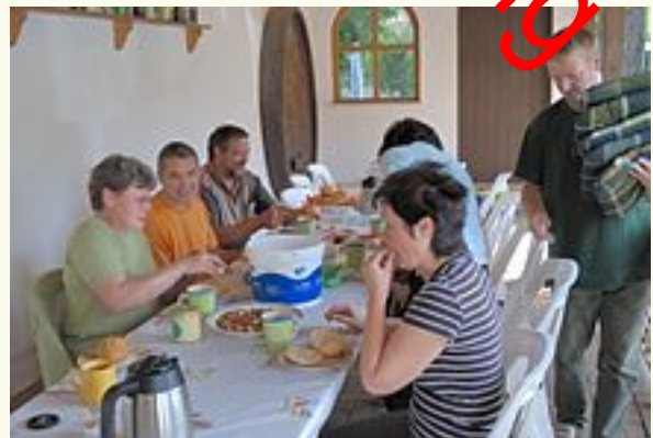
Ganz schön anstrengend das Ganze.