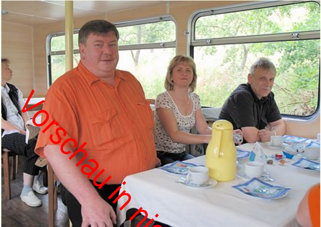
Die 10b machte erst eine kleine Flussfabrt. Die passende Gelegenheit festzustellen...