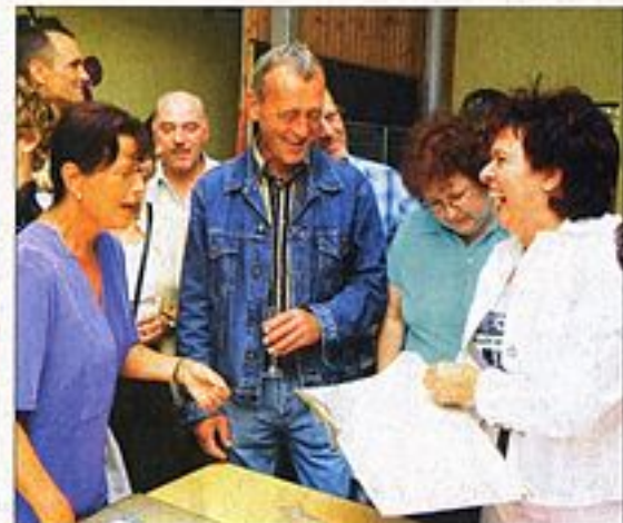
Noch nicht ganz vollständig: Drei der insgesamt vier Klassen des Abgangs-Jahrgangs 1977 traten auf dem Schulhof noch einmal in der alten Formation an.